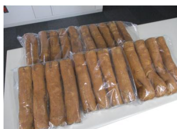
オリジナル食べ物 麩菓子で瓦を表現！ 市民会議みんなでおいしく試食しました！